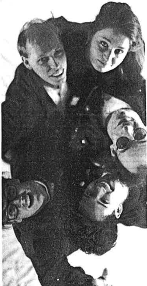
DIE „JELLYBABIES“ sind gegenüber musikalischen Experimenten jederzeit aufgeschlossen.