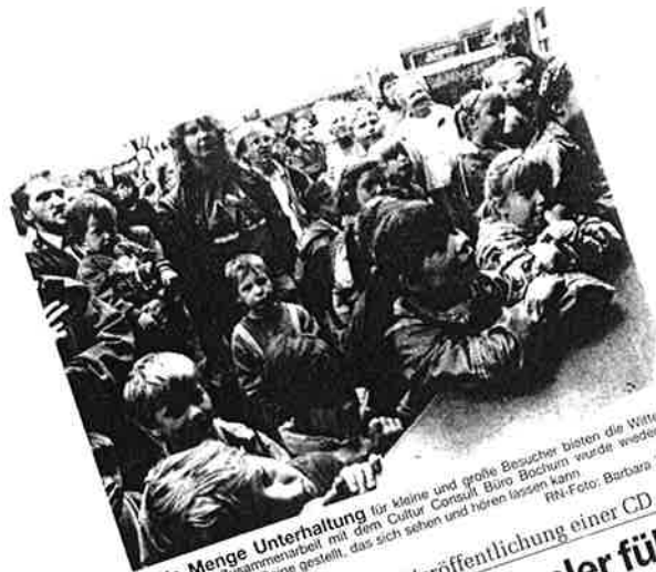
Jede Menge Unterhaltung für kleine und große Besucher bieten die Wittener Markttag. In Zusammenarbeit mit dem Kultur-Consult Büro Bochum wurde wieder ein Programm auf die Beine gestellt, das sich sehen und hören lassen kann.